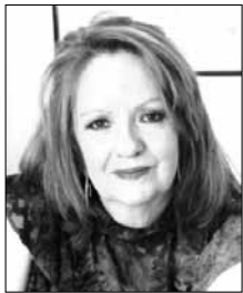
Γράφει η Ττίκα - Μαρία Σαράιτη*

Η Αγάπη κοίταζε μια τα δάχτυλά της μια έξω από το παράθυρο. Το σπίτι ήταν απέναντι από την Άρνη[1]. Έμεινε μόνη της η Αγάπη, η οικογένεια ήταν στο βουνό. Κρύβονταν. Ο φρουρός κοίταζε συνέχεια δεξιά-αριστερά. Προφανώς φοβόταν κάποια ξαφνική επίθεση από τους αντάρτες.