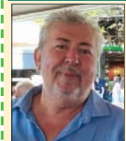
Γράφει ο Γιάννης Γριβέλλας

Τέσσερα χρόνια συμπληρώνονται φέτος από την φοβερή κακοκαιρία του Ιανουά. Τέσσερα χρόνια και οι πληγές στα ορεινά ακόμα υπάρχουν, όσο και να λένε οι υπεύθυνοι ότι οι αποκαταστάσεις έχουν σχεδόν ολοκληρωθεί.