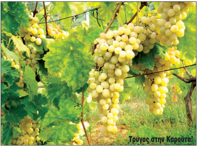
Τρύγος στην Καρούτα!