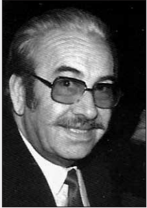
Γράφει ο Θωμάς Κίσισας

Τα τοπωνύμια είναι εκεί δεν φεύγουν, και θα μείνουν για πάντα. Τα επίθετα όμως που δίνουν το τοπωνύμιο χάνονται. Υπάρχει το τοπωνύμιο δεν υπάρχει το επίθετο.