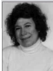
Γράφει η Σούλα Τσόκα - Κάμπα