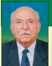
Γράφει ο Βασίλης Χρ. Καραγιάννης

Η λέξη "απαγορευμένο" για τους σημερινούς νέους του χωριού μας δεν σημαίνει και δεν φανερώνει τίποτα άλλο για τα ζωντανά απομνημεία μιας άλλης εποχής φέρνει στη μνήμη μας το ωραιότερο δάσος του χωριού μας αλλά και έναν μεγάλο πνεύμονα που τροφοδοτούσε τους κατοίκους του με καθαρό και δροσερό αεράκι κατά τους θερμούς μήνες του καλοκαιριού.