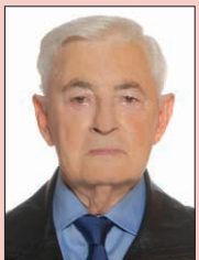
Γράφει ο Κώστας Ε. Τζωαννοπούλου

[ Η εισβολή των ανταρτών στην Καρδίτσα έγινε στις 11-12-1948 και η "κατοχή" διάρκεσε δύο ημέρες. Ένα γεγονός που σχολιάστηκε διαφορετικά από τις δύο πλευρές είναι η βίαιη επιστράτευση περίπου 1000 νεαρών παιδιών από 16 ετών και πάνω- αγοριών και κοριτσιών- τα οποία, ομολογουμένως έζησαν -όσα κατόρθωσαν να επιβιώσουν- τη χειρότερη περίοδο της ζωής τους. Οι αντάρτες ονόμασαν την πράξη τους αυτή "επιστράτευση